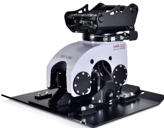
Abb. inkl. optionaler Verbreiterungsplatte

Die UAM proline Anbauverdichter erhalten ein noch umfangreicheres Einsatzgebiet durch die Verwendung von folgendem optionalem Zubehör: